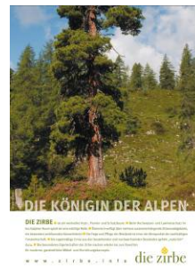
Die Königin der Alpen